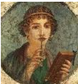
Affresco romano "Donna con stilo e libro" (detta Saffo) Pompei, 50 dopo Cristo. (Napoli-Museo Archeologico Nazionale)