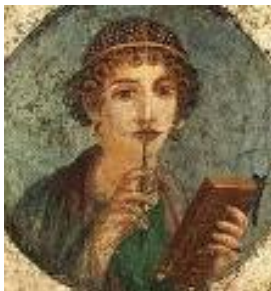
Affresco romano "Donna con stilo e libro" (detta Saffo) Pompei, 50 dopo Cristo. (Napoli-Museo Archeologico Nazionale)